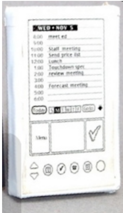
شکل ۱.۲: پیش‌نمونه پالم پایلوت